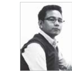
□ बुद्ध सुब्बा (वजी) कालेबुड