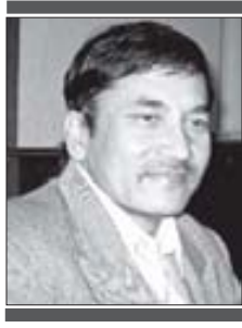
□ कालुसिंह रनपहेंली सिलगढी

खरायोलाई आफ्नो छिटो र छरितोपनको धाक थियो। कछुवालाई आफ्नो निरन्तरताको घमण्ड थियो। दुवै थिए प्रतिस्पर्धी। त्यो जीतको रेखा कुल्चनुको निम्ति दुवै आतुर थिए।