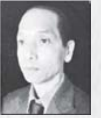
■ पासाड नरु लामा

अधिसम्म बाझाबाझ गरिरहेका कछुवा र खरायो अहिले शिकारीको झोलाभित्र अड्कमाल गरिरहेका प्रतीत पर्थ्यो। शिकारी दुबैलाई लिएर हिँड्यो अनि कछुवा र खरायोले दौडको निम्ति निर्धारित गरेका रेखा काटेर आफ्नो घरको बाटोतिर बढ्यो।